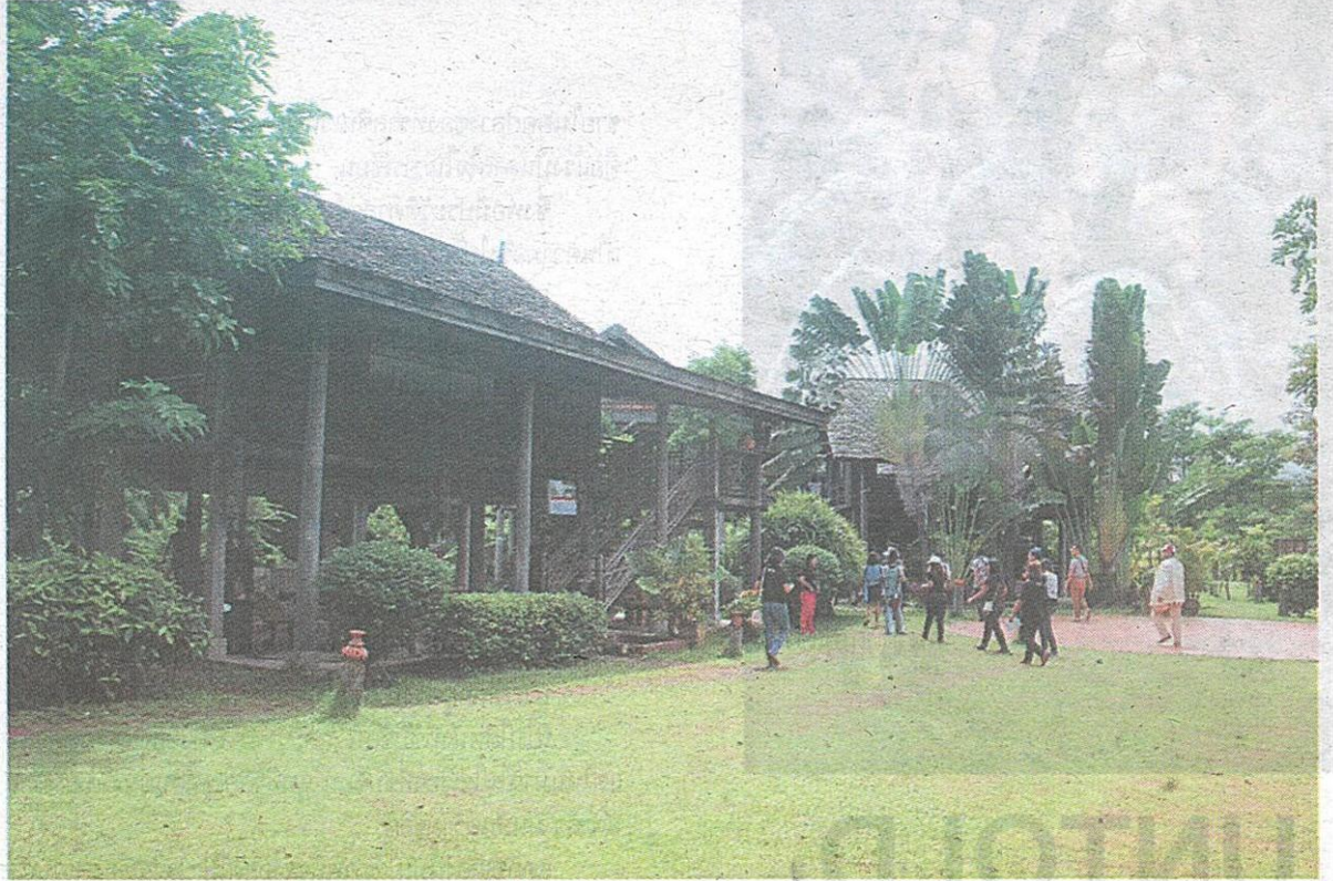
เรือนอีสานภายในพิพิธภัณฑ์

คอลัมน์: ตะลอนทัวร์: เที่ยวอีสานกลาง ชมถิ่นมหาสารคาม(จบ)