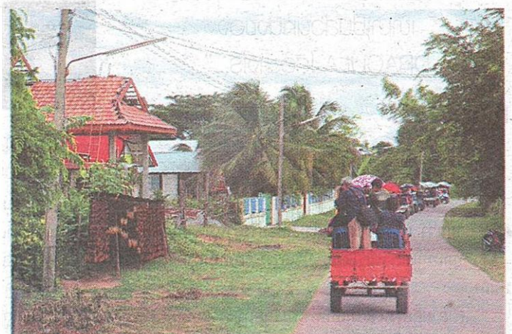
กตกกแห่งริมรั้วบ้าน