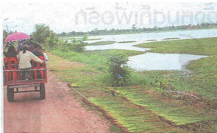
ก้ออพิภพเกษตร