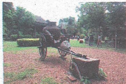
ด้านหน้าพิพิธภัณฑ์ มมส.

คนไปชมมากซึ่งเป็นวัตถุประสงค์ที่นำมาเป็นเลือกและผลิตภัณฑ์พื้นถิ่นหลากหลายชนิด มีลวดลายสวยงาม เป็นเอกลักษณ์เฉพาะถิ่นที่ขึ้นชื่อจนได้รับความนิยมไปทั่วโลก และกลายเป็นแหล่งศึกษาในงานในด้านการพัฒนาผลิตภัณฑ์ชุมชนอย่างแพร่หลาย